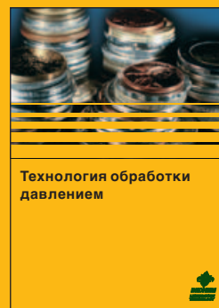
Технология обработки давлением